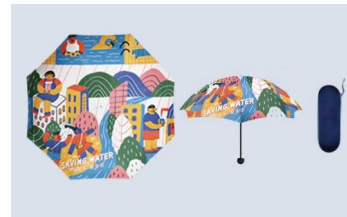
节水插画晴雨伞 （胶囊伞）