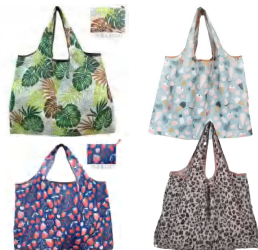
节水主题折叠收纳袋