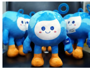
节水吉祥物“霖霖” 毛绒玩具