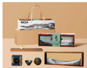
“绿水青山”文创套装 （非遗建盏/桐木万年历/创意流沙画）