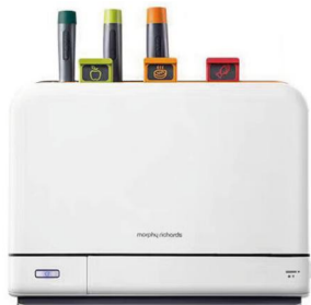
节水主题摩飞联名款 砧板刀具消毒烘干一体机