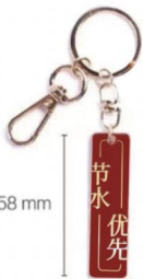
“节水优先”主题钥匙扣