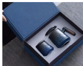
节水主题陶瓷杯礼盒套装 （带茶漏、同款茶叶罐）