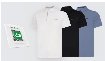
李宁联名款速干短袖POLO衫 （佩戴节水标志磁吸徽章） （多色可选）