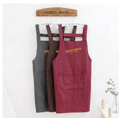
家庭节水主题围裙 （纯棉加防水内衬，三色混发）