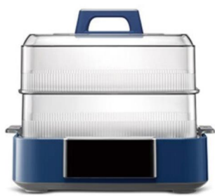
节水主题摩飞联名款 多功能电蒸锅