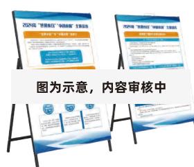
图为示意，内容审核中