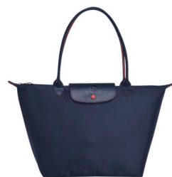
节水主题单肩珑骧包