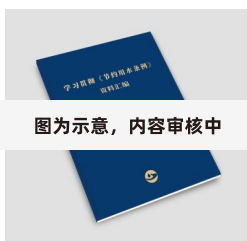
图为示意，内容审核中

学习贯彻《节约用水条例》折页 (综合篇、农业篇、工业篇、城镇生活篇) (8页双面覆膜)