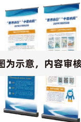
图为示意，内容审核中