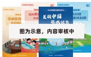
图为示意，内容审核中