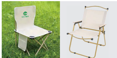
节水主题户外休闲椅 耐磨高密牛津布 (40cm×40cm×65cm)