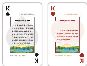
学习贯彻《节约用水条例》 撲蛋扑克（加厚，2副/套）