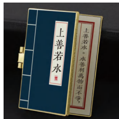
“上善若水”主题冰箱贴