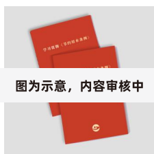
图为示意，内容审核中