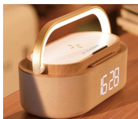
节水主题多功能蓝牙音响 （无线充电/小夜灯/收音机）