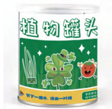
节水盆栽罐头植物 （盲盒混发）