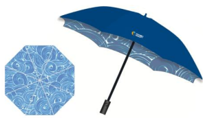
“节水中国行”晴雨双层伞 （自动手柄）